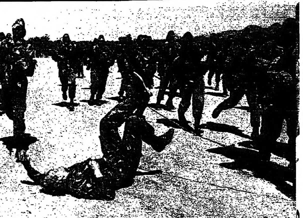
لقطة من الفيلم .. هجوم قوات الدولة العراقية على المرتزة الأبيض